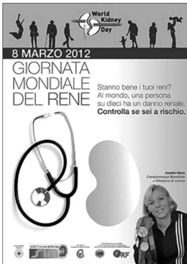
Fig. 1 - Poster della Giornata Mondiale del Rene, 2012, realizzato dallo studio Domina per conto FIR e SIN con Josefa Idem, testimonial dell'evento.

Complessivamente si può ben capire come la copertura dell'informazione relativamente alla GMR 2012 sia stata di elevato profilo (numerosi servizi televisivi RAI) completa e trasversale (anche per articoli pub-