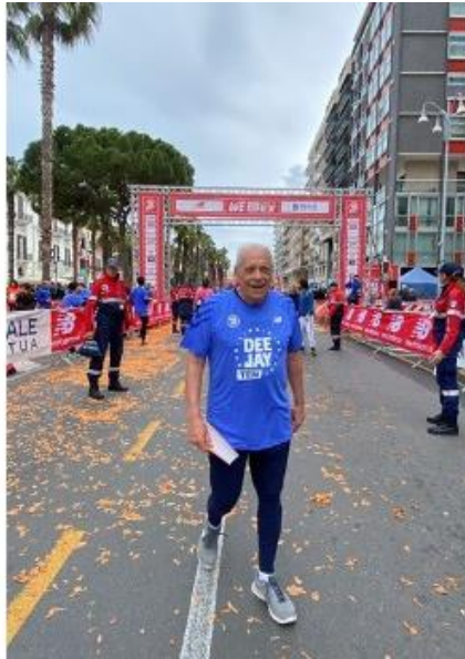
Figura 6: Arrivo al traguardo dopo aver percorso la Run Like a Deejay di 10 km in pianura a Bari nel marzo 2023.