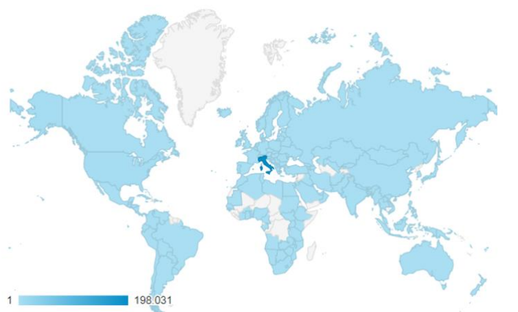
Figura 5: Mappa della provenienza geografica delle visite del sito web del GIN dal 1 gennaio 2022 ad oggi.

Degno di nota è che anche quest'anno abbiamo avuto lettori in quasi la totalità dei paesi di tutti i continenti.